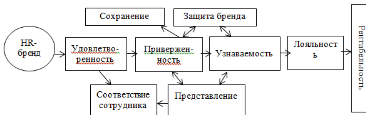
Рис. 1. – Зависимость уровня рентабельности от степени разработанности бренда

При формировании и внедрении программы HR-брендинга необходимо учитывать степень эффективности затрачиваемых ресурсов, то есть его рентабельность, как показано на рисунке 1 [3].