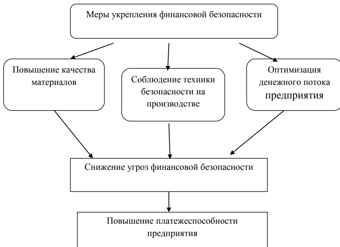
Рисунок 2 – Схема реализации мероприятий по укреплению финансовой безопасности предприятия

В целях укрепления финансовой безопасности предприятия следует принять следующие меры, необходимые для решения проблем и выявленных угроз, приведены на рисунке 2.