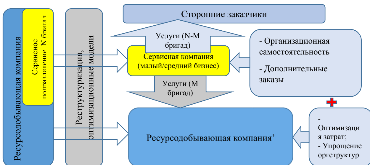
Рисунок 3 – Модель синергетического эффекта