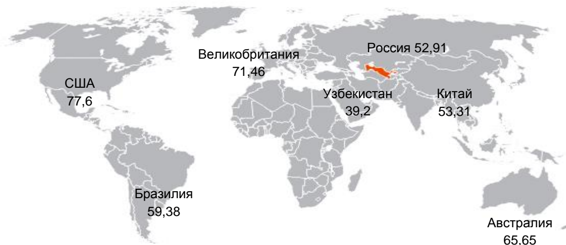
Рисунок 1. Доля сферы услуг в ВВП стран мира 2021 год (в %)

За 2021 год добавленная стоимость сферы услуг в ВВП (1-рисунок) Швейцарии составила 71,92 % 1) , Великобритании - 71,46 % 1) , Франции – 70,34 % 1) , Австралии - 65,65 % 1) , Германии - 62,88 % 1) , Бразилии – 59,38 % 1) , Китае – 53,31 % 1) , России – 52,91 % 1) .