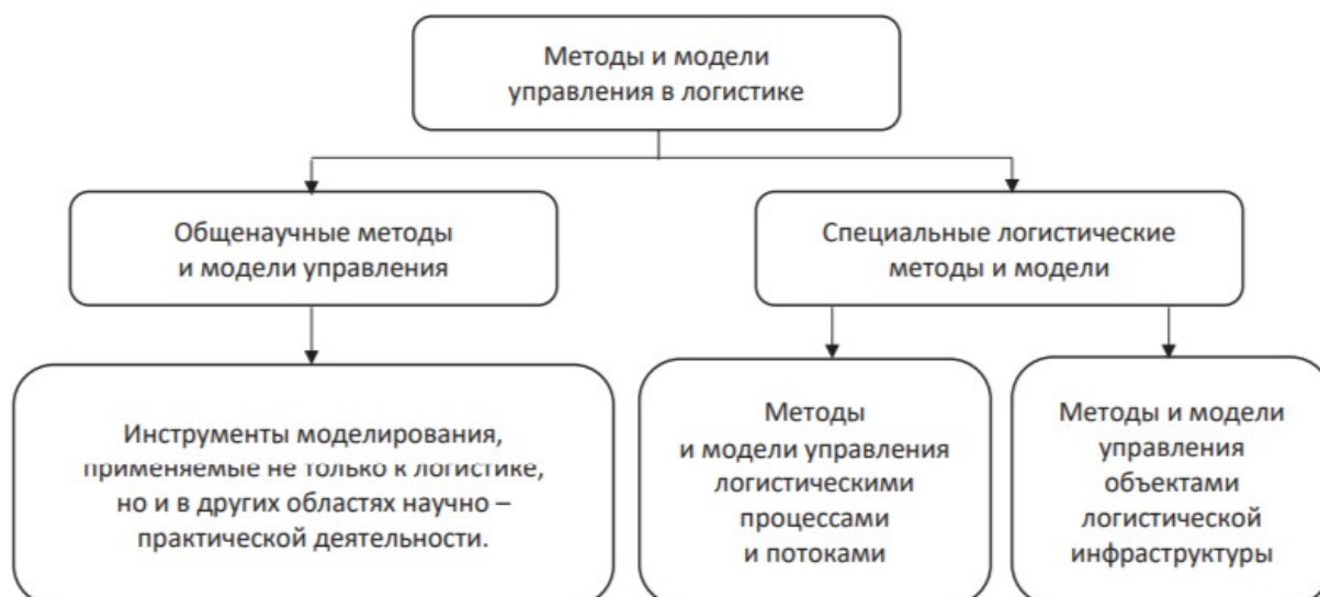
Рисунок 2 – Модели и методы управления в логистике

Интеграцию в цепи поставок можно рассматривать с точки зрения процесса взаимодействия всех участников цепи поставок, который ориентирован на достижение совместных результатов посредством масштабирования и упрочения связей производственно-технического характера, коллективного использования ресурсов и капиталов, а также формирования устойчивой благоприятной партнерской среды для осуществления общей экономической деятельности [1, с. 55].