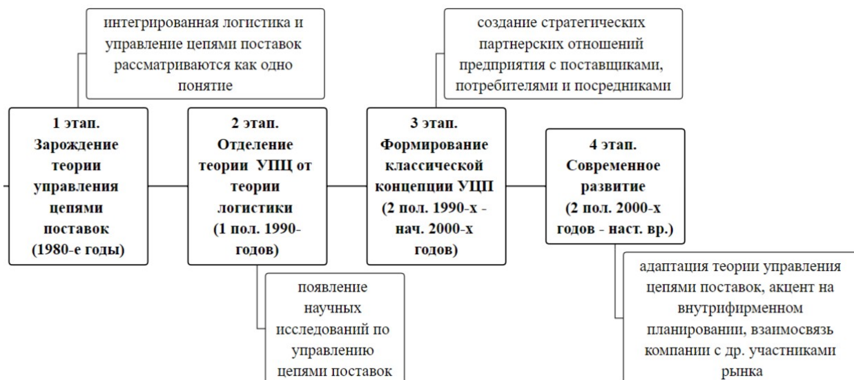
Рисунок 1 – Этапы становления управления цепей поставок

Этапы становления системы управления цепей поставок представлены на рисунке 1.