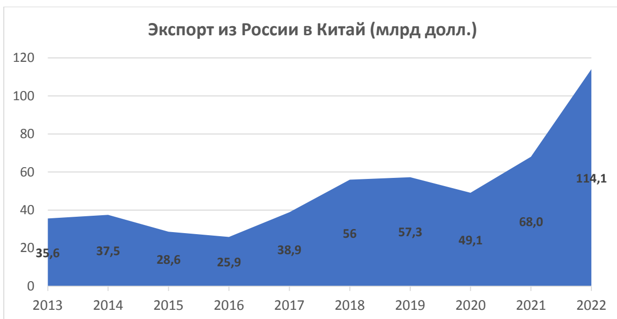
Рисунок 2 - Динамика объёма экспорта из России в Китай за последние 9 лет [3]

Помимо сотрудничества с Китаем, в последнее время рассматриваются двусторонние торгово-экономические отношения России и Индии. Две страны договорились работать вместе для решения проблем торгового дефицита и доступа к рынкам. Стоит отметить, что уже в 2022 году Россия стала крупнейшим поставщиком нефти в Индию [1], по причине продажи данного ресурса по сниженным ценам, после введения западных санкций. Таким образом, за последний год товарооборот с Индией также достиг рекордного уровня в 30 миллиардов долларов. Примечательно, что за этот период поставки нефти из России в Индию увеличились в 36 раз. Данные события подтверждают активное участие России в содружестве стран, описывая позитивное влияние партнерства с Индией в столь непростое время.