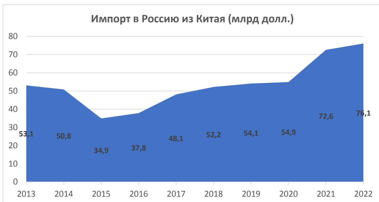
Рисунок 1- Динамика объёма импорта из Китая в Россию за последние 9 лет [3]

мире и отсутствия стабильности в целом. В такой непростой период наши страны способны помочь друг другу в экономическом развитии и обеспечении всеми необходимыми благами для стабильного и безбедного существования. Этому свидетельствует рекордный уровень торговли с Китаем в момент введения большого количества санкций со стороны запада. Для наглядности обращу внимание на рисунок 1 и рисунок 2, которые полностью отражают тенденцию усиления экономического сотрудничества Китая и России на современном этапе.