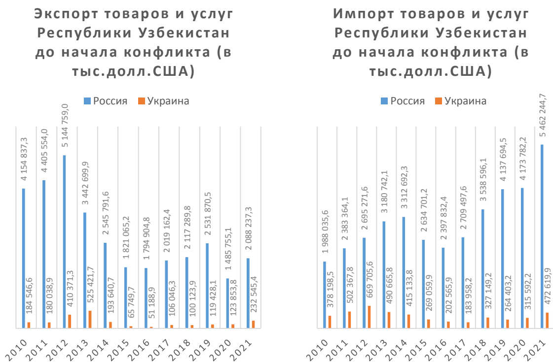
Диаграмма. Динамика экспорта 13 и импорта 14 товаров и услуг Республики Узбекистан в разрезе России и Украины до начала военного конфликта.

сотрудничает с Украиной по многим направлениям, в том числе в торгово-экономической, культурной, образовательной, сельскохозяйственной сферах. В 2021 году Украина стала девятой страной с наибольшим торговым оборотом 12 .