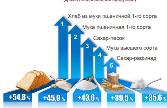
Топ товаров и услуг в потребительском секторе по приросту цен за 2022 год 18

Например, в феврале 2022 года годовая продовольственная инфляция замедлилась до 13,1% 19 , а в октябре выросла в годовом измерении до 16,3% 20 . В феврале 2023 года этот показатель в годовом исчислении (к февралю прошлого года) составила 15,4% 21 . В то же время темп роста гостиничных и ресторанных услуг увеличился с 14,7% до 21,7%.