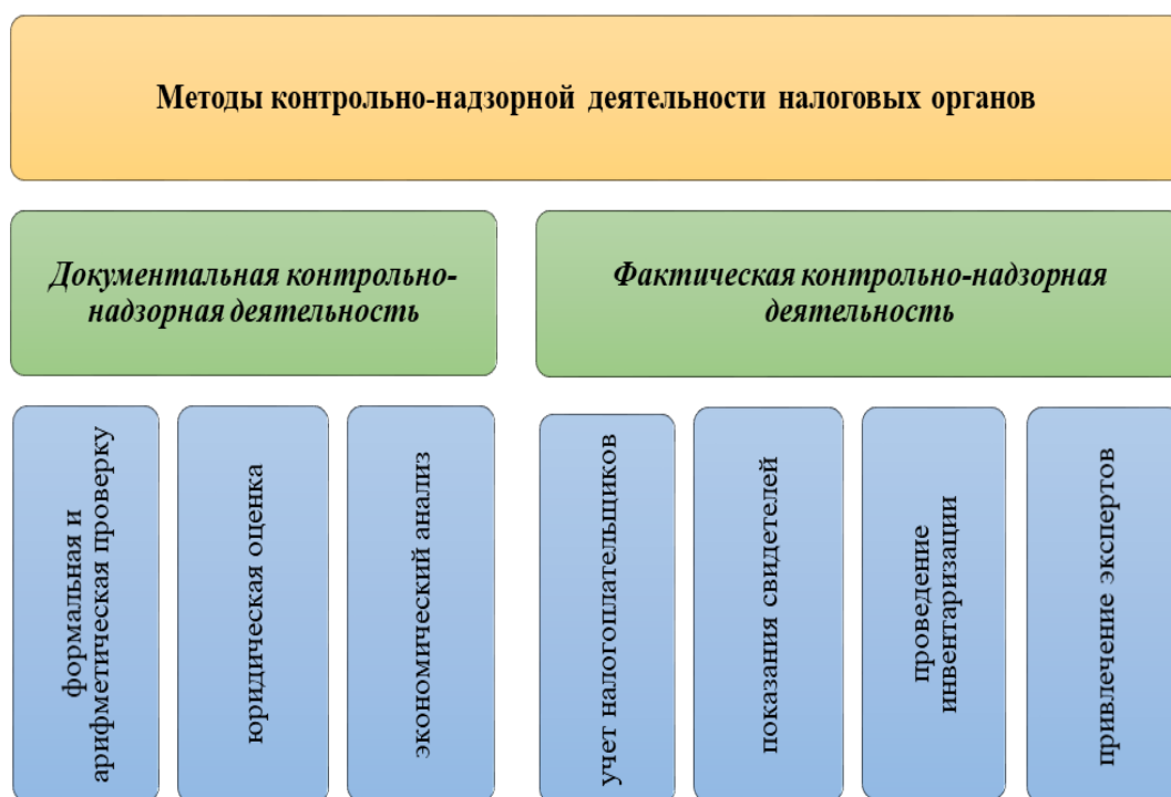
Рисунок 7 – Методы контрольно-надзорной деятельности налоговых органов

Осуществление контрольно-надзорной деятельности налоговых органов проходит в несколько этапов (рисунок 8).