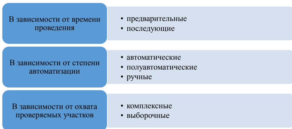
Рисунок 2 – Классификация процедур внутреннего контроля для обеспечения экономической безопасности организации

Для обеспечения экономической безопасности организации необходимо использовать следующие методы внутреннего контроля [2]: