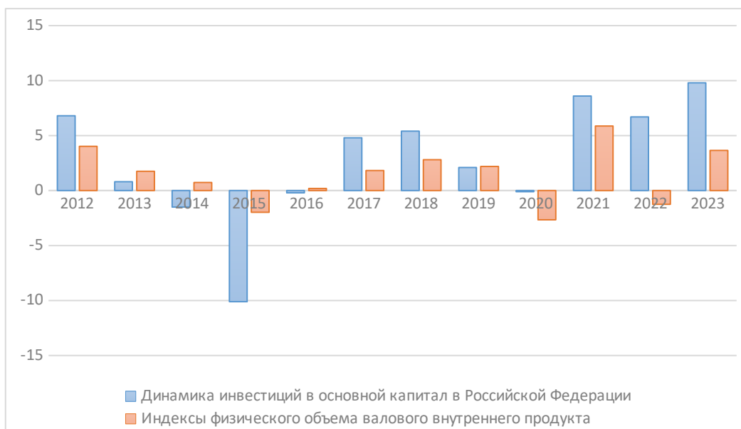
Рис. 2 - Прирост ВВП России и инвестиций в основной капитал, в процентах к предыдущему году 2

рассмотрим показатели без инфляционного роста на рисунке 2: 1) Динамика инвестиций в основной капитал, изменение в процентах к предыдущему году. 2) Индекс физического объёма ВВП, изменение в процентах к предыдущему году.