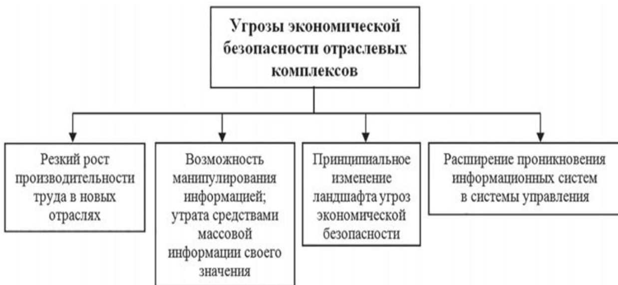
Рисунок 4. Угрозы экономической безопасности отраслевых комплексов в условиях цифровой экономики

В принципе, организация многоцелевой системы экономической безопасности оказывается сложной задачей по причине функционирования каждого предприятия в своем сегменте рынка.