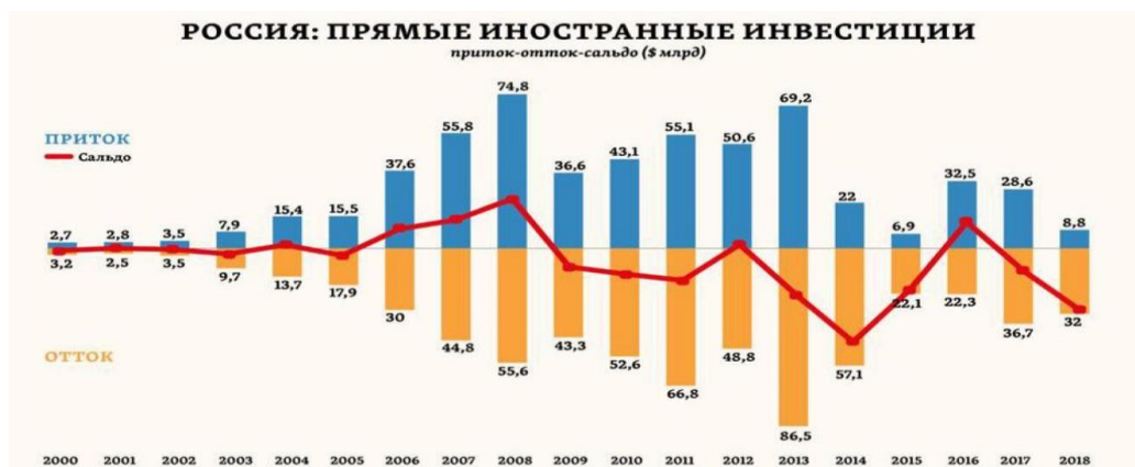
Рисунок 3. Иностранные инвестиции (Россия)

объясняет отсутствие у него мотивов вкладывать в экономику нашей страны.