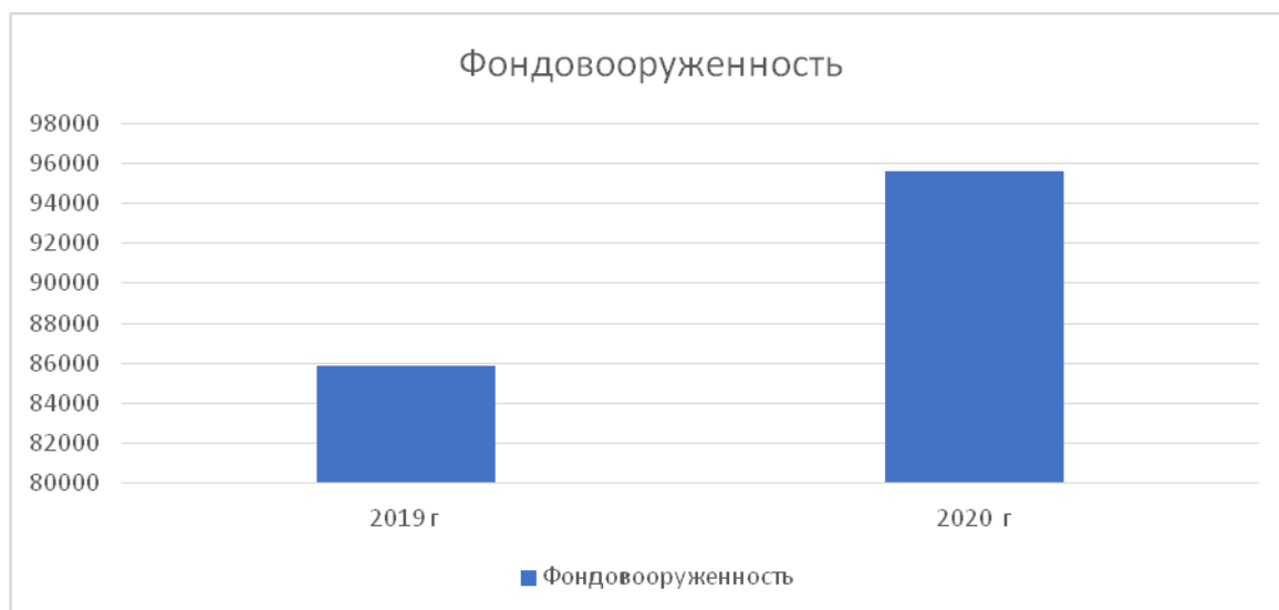
Рисунок 2- Динамика фондовооруженности УП «O'ztemiyo'lmashta'mir» за 2019-2020гг.

На рисунке 2 можно наблюдать рост фондовооруженности в 2020 г., что говорит о повышении технической оснащенности предприятия.