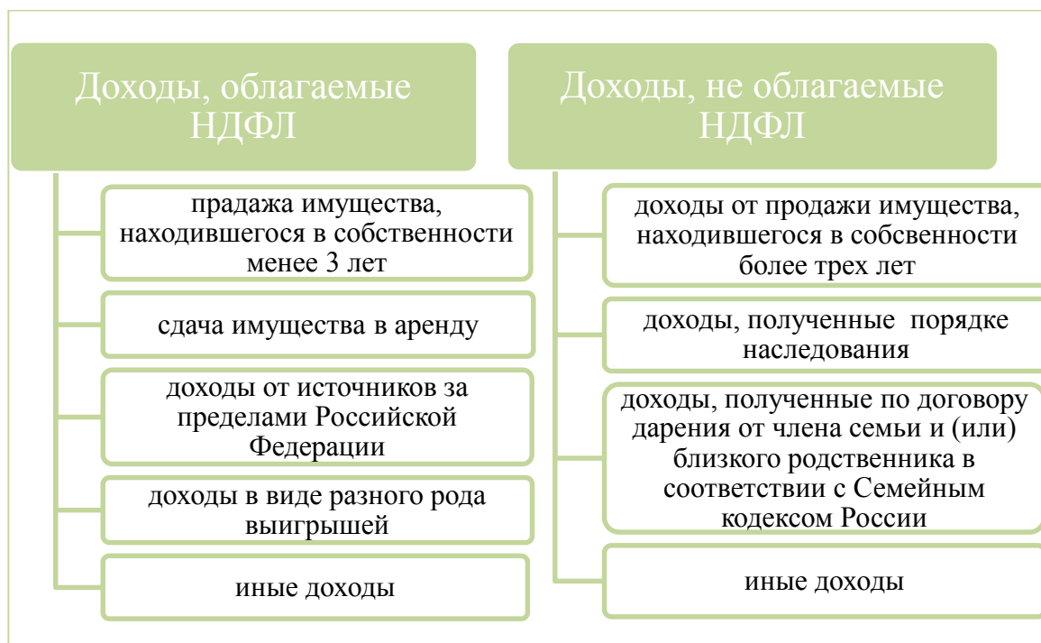
Рис. 2. Перечень облагаемых и не облагаемых доходов физических лиц по НДФЛ

Так же стоит отметить, что в соответствии со ст. 217 НК РФ не все доходы физических лиц облагаются данным налогом (рис. 2.) [2,4]