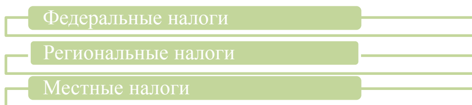
Рис. 1. Виды налогов по территориальному признаку

Налоги, в Российской Федерации классифицируются по разным признакам, но одним из основных является деление налогов по территориальному признаку, который подразделяется на три вида (рис. 1.) [3]: