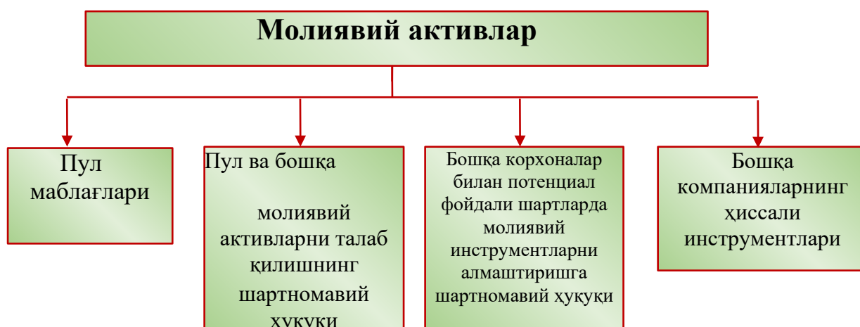
1-расм. Молиявий активларнинг таркиби (Б.Боронов,2020).

ахборотларни талаб этади. Бу ўз навбатида пул маблағлари ҳисобини халқаро стандартлар асосида такомиллаштириш заруриятини келтириб чиқаради.