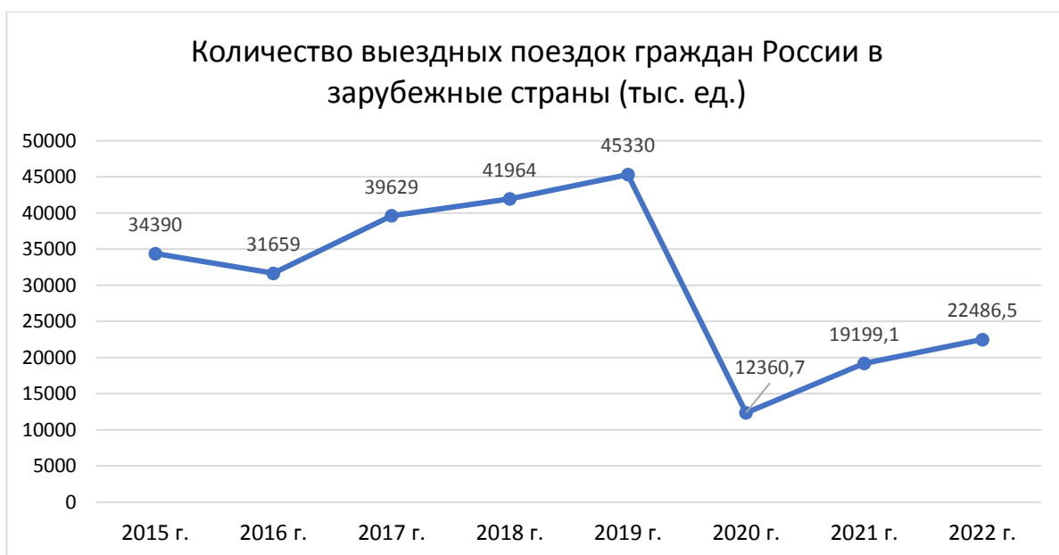
Рисунок 3 – Зарубежные туристические поездки граждан России в период с 2015 по 2022 г. [3]

Полученная информация свидетельствует о плавном развитии зарубежного туризма в период до наступления пандемии Covid-19, после чего был зафиксирован резкий спад в связи с объявлением режима самоизоляции. Затем, можно заметить медленный рост количества поездок за последние три года и попытки вернуться к прежним темпам развития туризма в России. Однако с наступлением напряжённой политической обстановки, скорее всего, линия на данном графике в скором времени будет продолжать падать, и о возможности роста количества зарубежных туристических поездок нецелесообразно заявлять в ближайшие годы. Поэтому важно определить какие цели и задачи должны поставить перед собой туристические фирмы и государство в целом для развития этой отрасли.