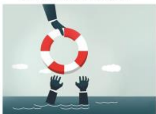
Zarar keltiruvchi shartnomalar bo'yicha