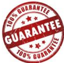
Kafolatli majburiyatlar bo'yicha