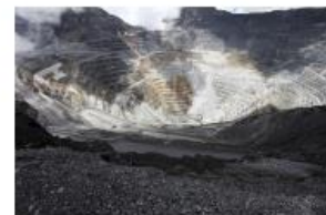
Atrof muhitni qayta tiklash bo'yicha