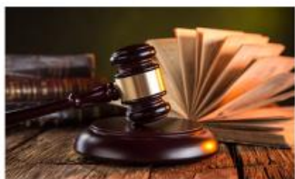
Sud nizolari bo'yicha