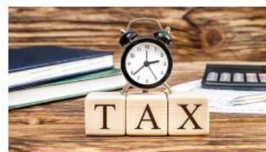
Soliq risklari bo'yicha