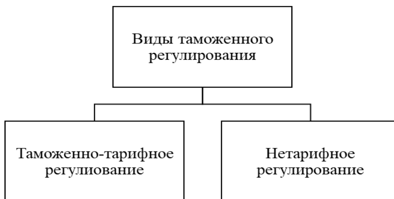
Рис.1. Виды таможенного регулирования 3

Нормативно-правовой базой таможенного регулирования в Российской Федерации является Таможенный Кодекс ЕАЭС и Федеральный закон о таможенном регулировании 289. Эти законодательства гармонизированы между собой и позволяют полностью регламентировать все нюансы таможенного регулирования. Таможенное регулирование ВЭД в России осуществляют таможенные органы.