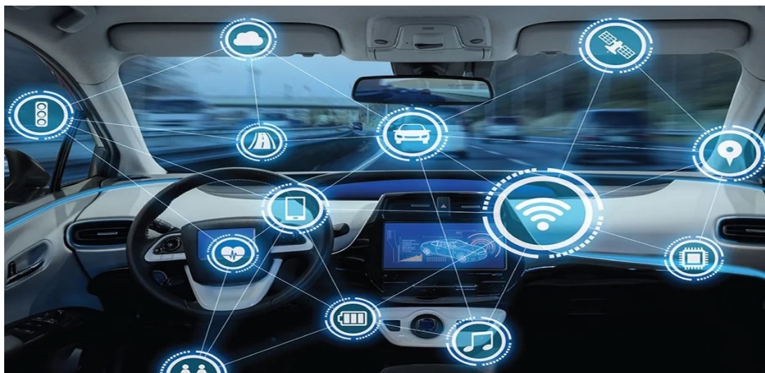
1-rasm. Avtomobil monitoringi uchun echimlarga misollar

Ushbu tizimlar, shuningdek, avtomobillarni aqlli shahar tizimlariga va intellektual transport texnologiyalariga ulash imkoniyatiga ega bo'lgan yangi narsalar Interneti (IoT) dan ham foyda ko'radi.