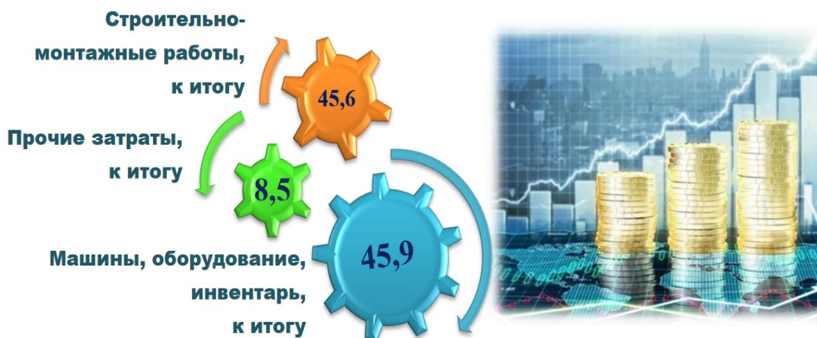
Рисунок 3. Технологическая структура инвестиций в основной капитал за январь-июнь 2023 года (в% к итогу) [5]

На внедрение автоматизированной системы контроля и учета природного газа; на расширение станции со строительством парогазовых установок; на строительство двух газотурбинных установок; на модернизацию технологических устройств и расширение систем связи; на улучшению управления водными ресурсами в Южном Каракалпакстане.