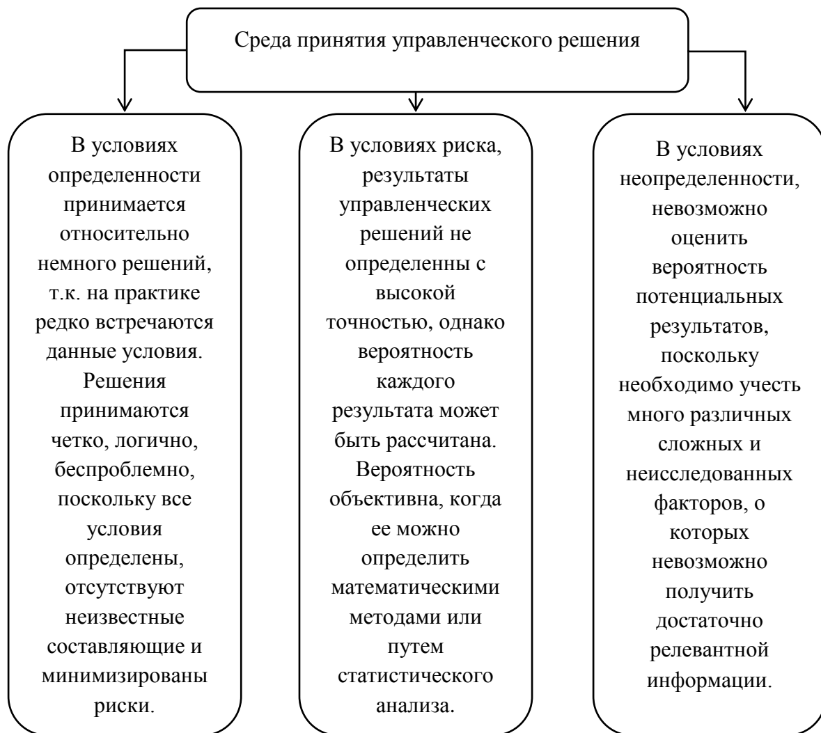
Рис. 2. Виды среды, в которой принимаются управленческие решения

формирования всех управленческих решений лежит система ценностей лица, принимающего решение [3].