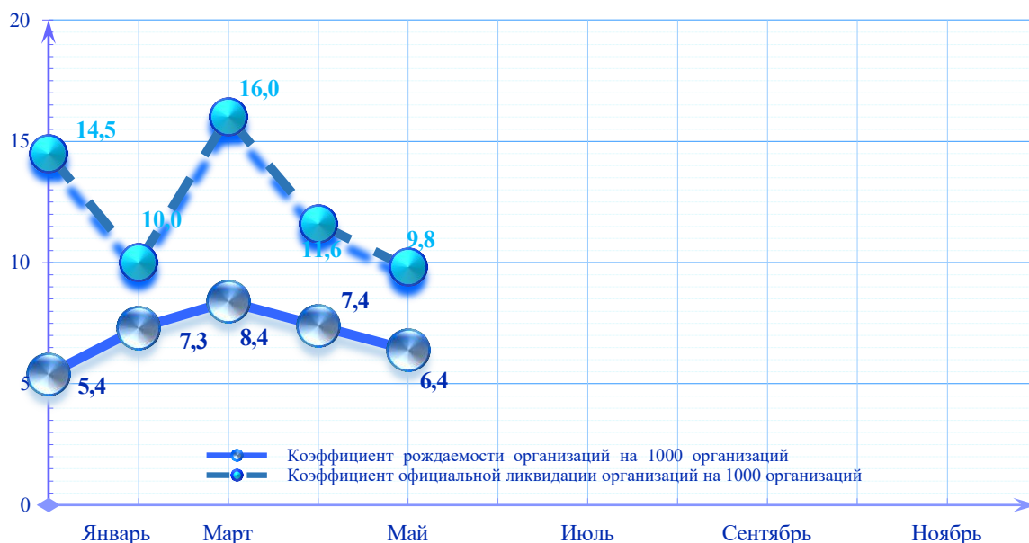
Рисунок 2 – Показатели демографии предприятий и организаций по РУ в целом, 2022 г.