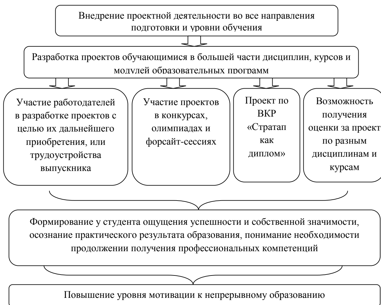
Рисунок 2 – Предлагаемая модель системного подхода к организации проектной деятельности в вузах с целью формирования у обучающихся мотивации к непрерывному образованию

Модель внедрения системного подхода к организации проектной деятельности в РАНХиГС, способствующего повышению уровня мотивации в непрерывному образованию, представим в виде рисунка 2.