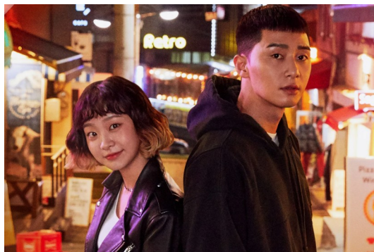
Дорама «Итэвон Класс»

трансформации позволяют зрителям лучше понимать героев, ощущая с ними тесную эмоциональную связь. Сюжетные линии часто включают элементы саморазвития, социальной адаптации и преодоления трудностей, что делает их особенно близкими зрителям.