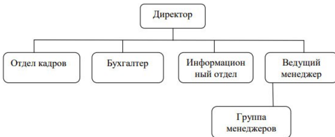
Рисунок 2 – Организационная структура ООО «Слава 07»

Бухгалтерия осуществляет учет средств организации и хозяйственных операций с материальными и денежными ресурсами, устанавливает результаты финансово-хозяйственной деятельности организации. Руководит работой по планированию и экономическому стимулированию, повышению производительности труда, выявлению и использованию производственных резервов по улучшению производства, труда и заработной платы и др.