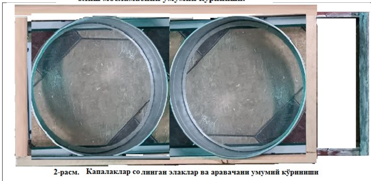
2-расм. Капалаклар солинган элаклар ва аравагани умумий кўриниши