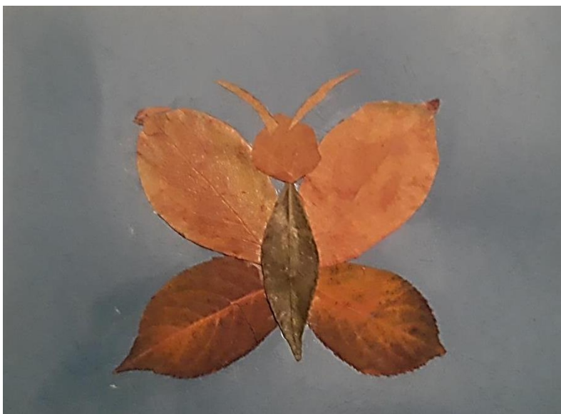
Рис. 2. Аппликация из засушенных растений

(развивает творчество, мышление, наблюдательность, трудолюбие, художественный вкус. Какую богатую фантазию надо иметь, чтобы из осенних листьев сделать деревья, животных, цветы);