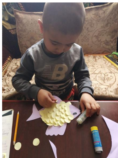
Рис.5. центрально - лучевой

(узор развивается в направлении от центра украшения равномерно к краям, углам, сторонам в зависимости от того, на предмете кокой формы он расположен)