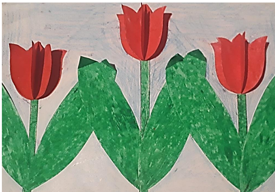
Рис.4. Ленточная аппликация