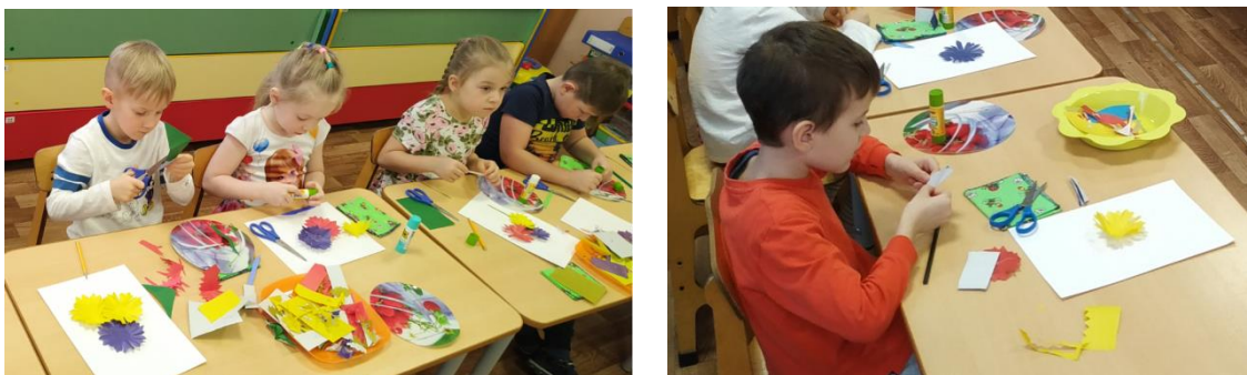
рис. 1 Аппликация в изобразительной деятельности