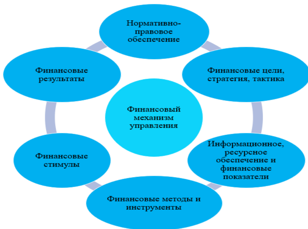
Рисунок 2 Механизм финансового управления

Проведенное исследование дает возможность разработать авторский подход к трактовке понятия «механизм финансового управления» высших учебных заведений (см. рисунок 2). По нашему мнению, механизм управления финансовыми ресурсами высших учебных заведений является составной частью механизма организации и проведения деятельности, связанной с реализацией задач, поставленных государством и обществом, форм и типов организации финансовых отношений по формированию и расходованию финансовых ресурсов направлено на реализацию стратегических и тактических целей и представляет собой совокупность методов.