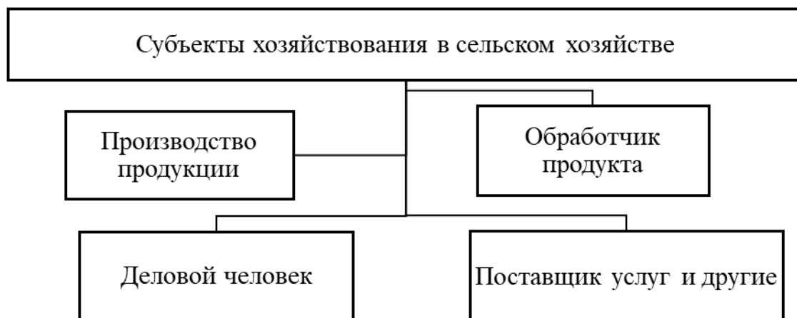
Фигура 2. Классификация субъектов малого бизнеса и частного предпринимательства в сельском хозяйстве.

Субъекты малого предпринимательства, осуществляющие деятельность в сельском хозяйстве, по своим специфическим характеристикам и направлениям можно охарактеризовать следующим образом (рис. 2).