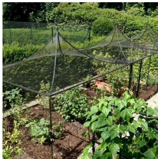
Рис. 1. Сборно-разборные многоярусные фруктовые клетки «В замке Лисмор в Ирландии сад площадью семь акров включает в себя огород для выращивания фруктов и овощей, используемый рестораном и семьей» 1 .

Таким образом, фруктовые клетки - это не только гуманный способ держать птиц подальше от ваших ягод, не уничтожая их, неся урон природе, но и несравненный элемент ландшафтного дизайна сада, его изюминка. Некоторые дизайнеры создают великолепные деревянные клетки для проектов, в том числе сделанные на заказ версии из дуба с потрясающими остроконечными крышами с резными украшениями из ананаса и декоративными свинцовыми вставками.