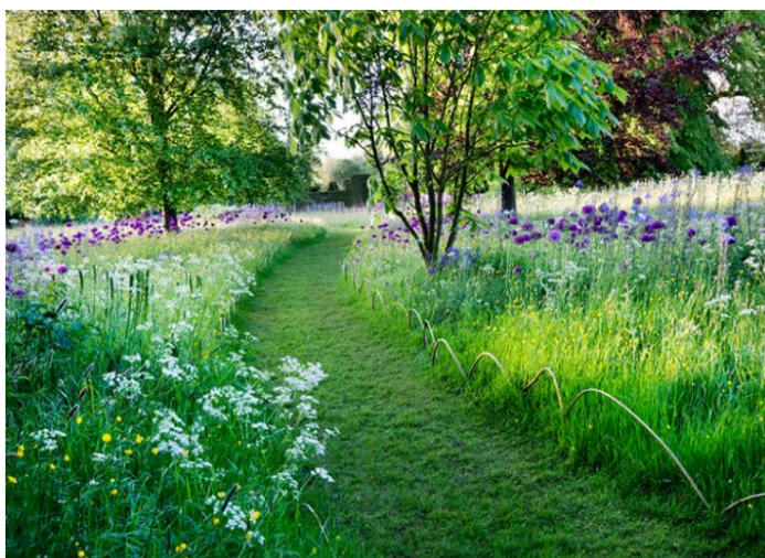
Рис.2. Скошенные травяные дорожки

Скошенные дорожки придают более ухоженный вид этой «обновленной» собственности, ведь экологическая составляющая такого метода, оттеняется водосберегающими свойствами скошенной травяной дорожки: вода в жарком, сухом климате не испаряется с поверхности бетонной плитки, создавая удушливый парниковый эффект, а впитывается в почву и создаёт приятную прохладу, микроклимат. Газоны всегда скашиваются, оставляя участки с более высокой травой, благоприятной для дикой природы, - случайным образом, который постоянно меняется. Трава со ступеньками обрамлена ажурными многолетниками и пенистой листвой (Рис.2).