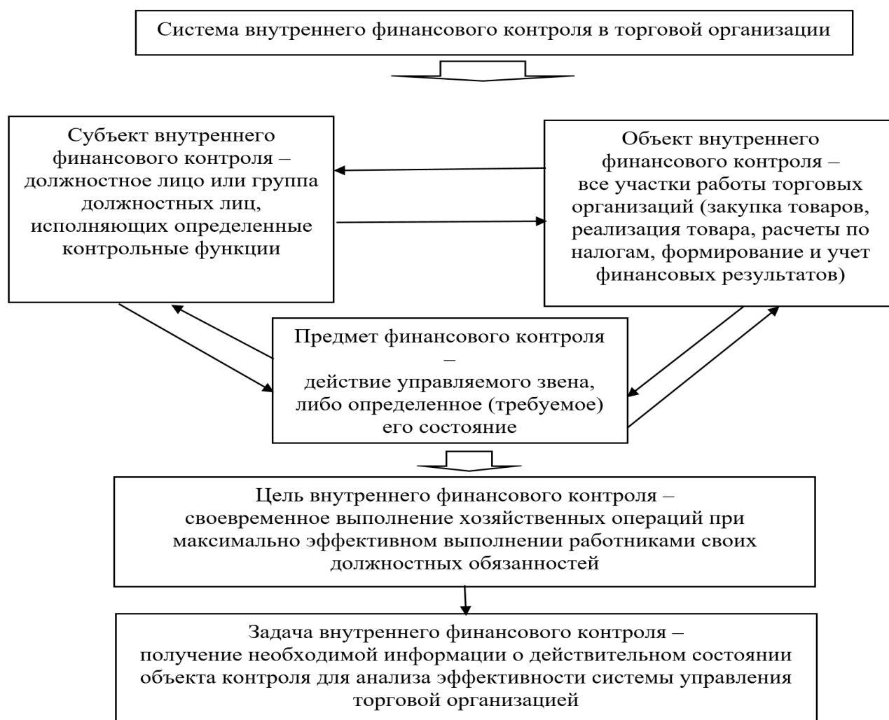
Рисунок 1 – Система внутреннего финансового контроля в торговой организации

Особенности торговых организаций, которые нужно учитывать при организации системы внутреннего финансового контроля, перечислены на рисунке 2.