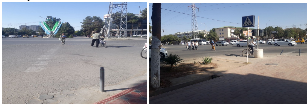
1- rasm. Piyoda va velosipedchilarining chorraxalarda xarakatlanish holatlari.

Tahlil va natijalar. Tadqiqot ishida Termiz shahridagi At-Termiziy, Alisher Navoiy koʻchalari chorraxasidagi qoplama ustida joylashgan tartibga solinmagan va tartibga solingan piyodalar oʻtish joyidan oʻtuvchi piyodalarning harakatlanish holatlari oʻrganildi. Tanlab olingan obʼektning tartibga solingan va tartibga solinmagan chorraxalar mintaqasida oʻtkazilgan tadqiqotlar natijasi boʻyicha xulosa qilib shuni aytish mumkinki, piyodalarning tartibga solinmagan chorraxalar mintaqasidagi piyodalar oʻtish joyidagi harakatlanish holatlari, ularning tartibga solingan chorraxalar mintaqasidagi harakatlanish holatlaridan yuqori qiymatni tashkil qildi.